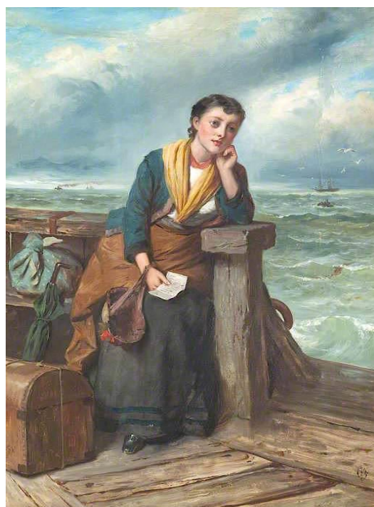
Μετανάστρια -Edward Charles Barnes https://antikleidi.com/2015