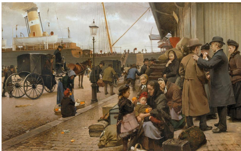
Οι μετανάστες του Larsens Plads -Edvard Petersen – 1890 https://antikleidi.com/2015